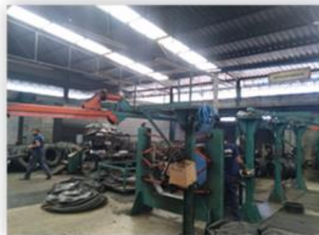
Montagem e recapagem